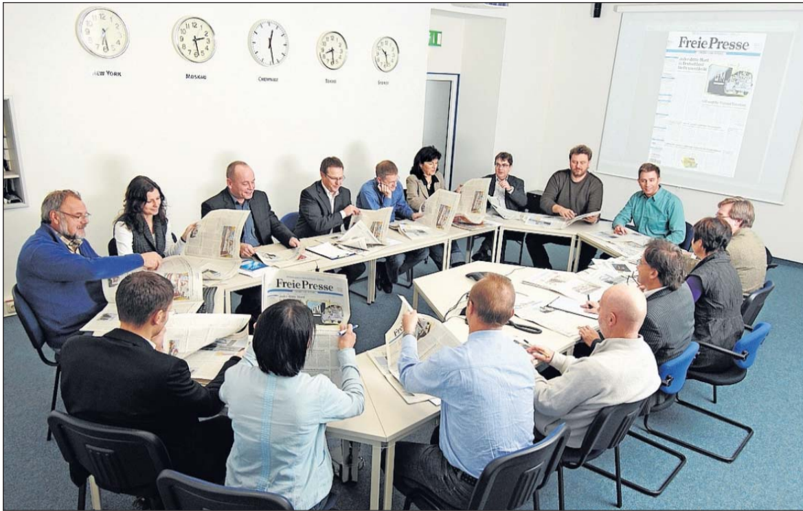
Die 12-Uhr-Redaktionskonferenz im Newsroom. Hier wird die aktuelle, gedruckte Ausgabe noch einmal kritisch unter die Lupe genommen und die Themen für den nächsten Tag abgestimmt.